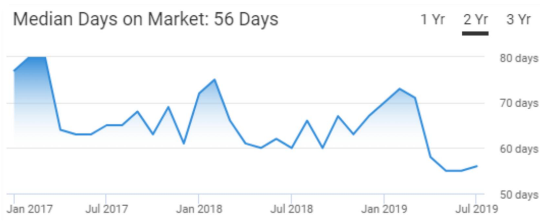
(ベーカーズフィールド：物件の広告掲載日数)

ベーカーズフィールドは前橋・高崎と物件価格と戸建家賃がとてもよく似ています。私が全米50州の中から、ニューヨーク・ホノルルやテキサス州ではなくカリフォルニア州ベーカーズフィールドを選んだ理由です。諸条件がよく似ているので物件価格と賃料を一見すれば、賃貸経営に向いているかどうかを瞬時に判断できます。とは言え、アメリカと日本の大きな違いは「立地」です。ベーカーズフィールドは比較的安全な街ではありますが、通り1本で治安が一変してしまうのがアメリカです。現地を見ずに購入するのは危険な投資ですから、実際に現地に赴き、治安と物件を確認して購入の可否を決めるのは必須です。